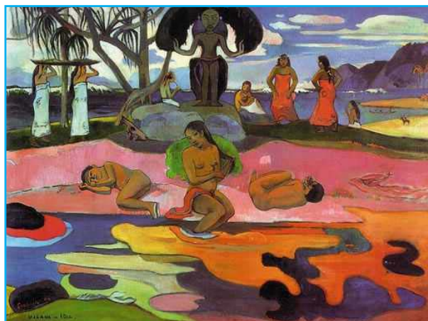
Mahana No Atua - Paul Gauguin